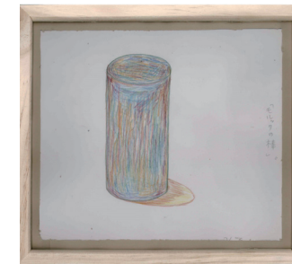
「モルックの棒」福本博之 / 達磨寺