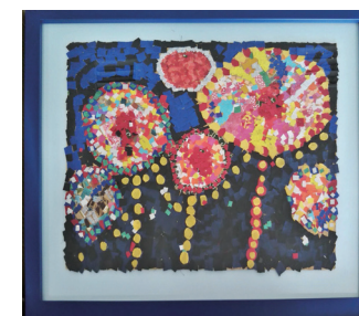
「花火」武弘美 / 喫茶 ナチャー