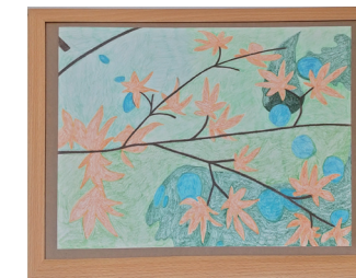
「もみじの杖」曲直部元康 / 談山神社