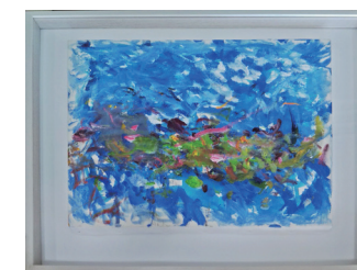
「さかなの遠足」山口みづほ ヘアウィズエステM+D