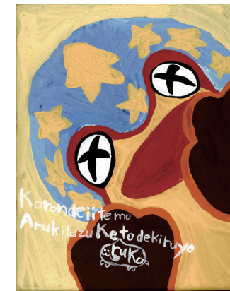
「korondeiitemo Arukituzukerukotodekiruyo」向川貴大 / 海龍王寺