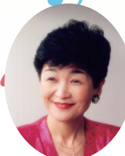
【音楽監督】 松本 真理子

音楽監督: 松本真理子 音楽監督補: 大江可奈子 振付指導者: HIRO 司会者: 佐々木ひろみ